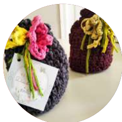
Dia da Mãe