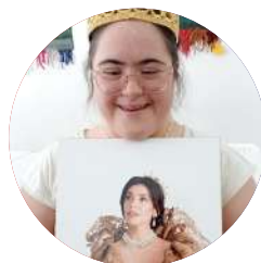
Era uma vez