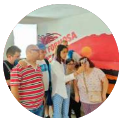
Algarve Design Meeting