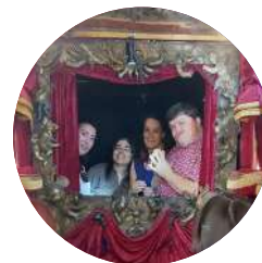
PELE - Teatro Flaminga