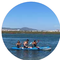
Vela e Canoagem